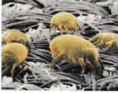
الوثيقة 3 أحد مسببات الحساسية

إن النظام المناعي موجه طبيعيا نحو إبطال مفعول الأجسام الغريبة ( مولدات الضد ) المضرة وتخليص العضوية منها بفضل آليات الدفاع المناسبة، إلا أنه في بعض الحالات يحدث أن هذه مولدات الضد (الغبار، القراديات، السمك، الفراولة، حبوب الطلع وغيرها) التي لا تكون في الأصل ضارة ويتقبلها النظام المناعي فتصبح سببا لاضطرابات في عمل العضوية عند بعض الأشخاص .