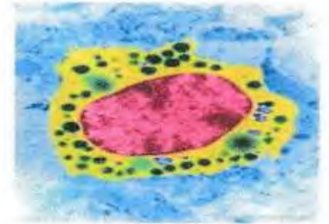
الوثيقة 4 خلية الماستوسيت في حالة راحة

إعتادا على السياق والوثائق ومكتسباتك القبلية أجب عن التعليمات التالية :