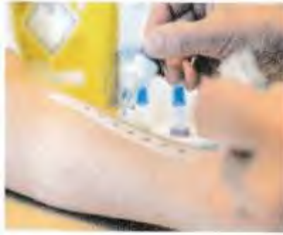
الوثيقة 2 إختبارات جلدية