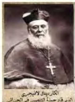
الكاردينال لانجيري الذي قاد حملة التنصير في الجزائر