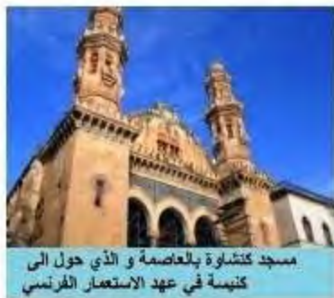
مسجد كمشاوة بالعاصمة و الذي حول الى كنيسة في عهد الاستعمار الفرنسي

السند: 02) (لقد وضعنا أيدينا على أموال الوقف و قضينا على مدارس و مساجد كانت موجودة...)) تقرير لجنة لاسكوتار الفرنسية 1878م