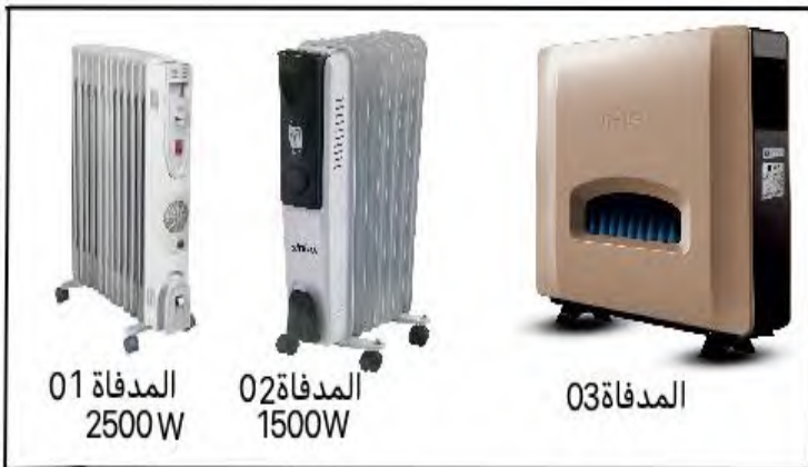
المدفأة 01 2500W