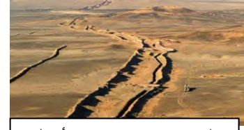
الموقع منخفض في الأصل

إعتمادا على السياق والسندات والمكتسبات السابقة :