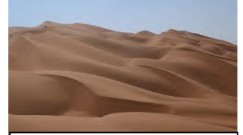
كثبان رملية متحركة