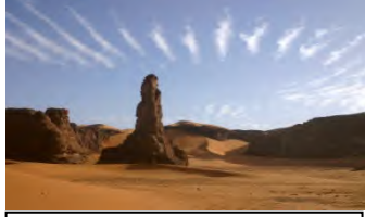
منخفضات بين الصخور