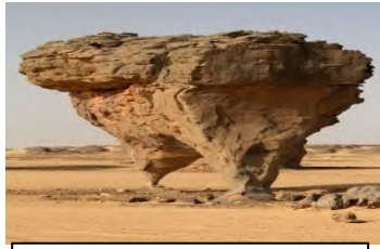
أشكال صخرية منحوتة