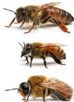
السند - 2