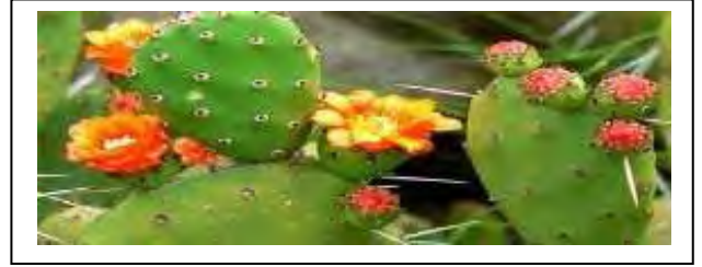
السند 01 : نبات التين الشوكي

التعليمات : من خلال النص و السنتين و معلوماتك