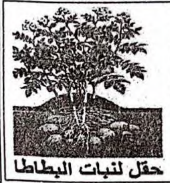
حقل لنبات البطاطا