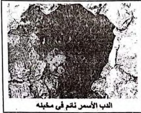
الدب الأسمر نائم في مخبئه

سنويا تغادر بعض الطيور البرية مواطنها الأصلية باتجاه إفريقيا من الجزائر وفي أيار أكتوبر سنة 2005 تم إحصاء ما يقارب 4000 مهاجر ببخيرة رغاية بالجزائر العاصمة.