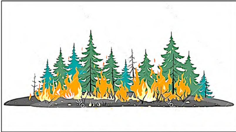
السند 02: حرائق الغابات خطر على النظام البيئي