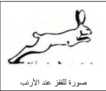
صورة للقفز عند الأرنب