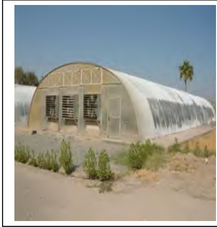
الوثيقة - 2 -