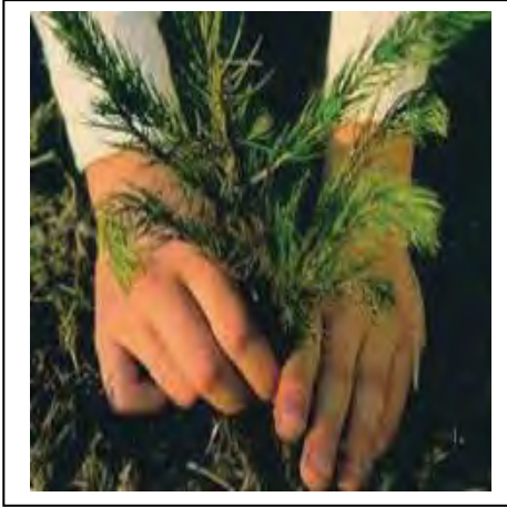
الوثيقة - 3 -