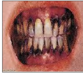
الوثيقة 2: أسنان شخص مدمن