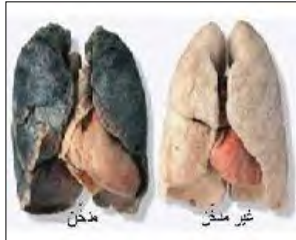
الوثيقة 3: رئة سليمة و رئة مصابة

بينما كنت تشاهد التلفاز مع أختك الصغرى شاهدتم حصة أضرار التدخين على صحة الإنسان، حيث يمثل يوم 31 ماي اليوم العالمي بدون تدخين. التدخين يؤثر سلبا على صحة الإنسان حيث يؤدي إلى هزال الجسم و اصفرار الأسنان و الروائح الكريهة.