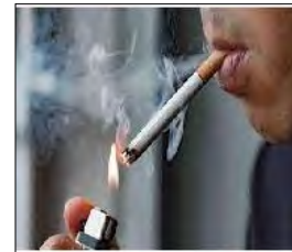
الوثيقة 1: شخص مدمن