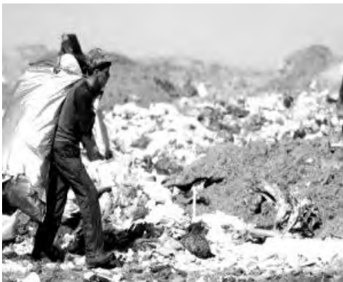
مكان إفراغ النفايات (مزبلة)