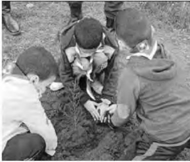
السند 3: عملية التشجير