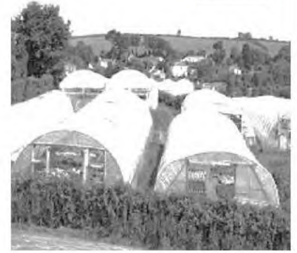
السند 1: الزراعة في البيوت البلاستيكية