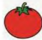
ma – te – to