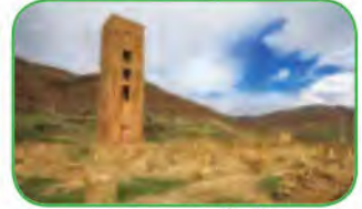
قَلْعَةُ بَنِي حَمَاد