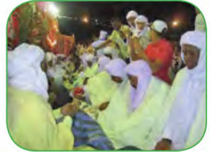
أهلبل قورارة: تراث شبري وغبلي من الجنوب