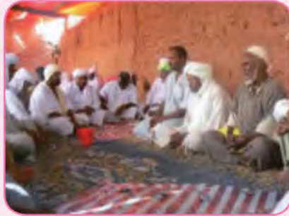
حِوَارٌ حَوْلَ قَضَايَا اجْتِمَاعِيَّةِ