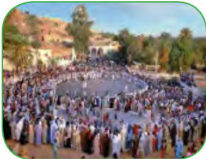
الاحتفال بالمولد النبوي الشريف في السائرة.