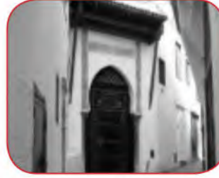
حي القصبية (الجزائر العاصمة)