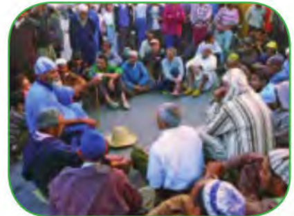
الفرال أو المداغ أو الحكواتي