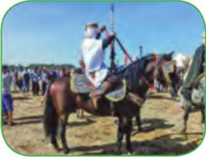
وعدة سبدي بوشبي مرسى بن مهدي