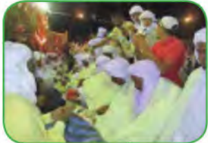
أَمْهَالِيلُ قُورْلُوةِ (تَيْمِيمُون)