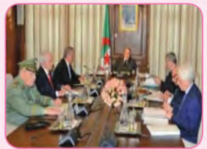
حِوَارٌ حَوْلَ قَضَايَا وَطَنِيَّةِ