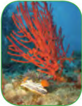
مِن بَيْنِ الأَحْجارِ الكَرِيْمَةِ الَّتِي تُشْتَهَرُ بِهَا القَالَةُ المُرْجَانُ