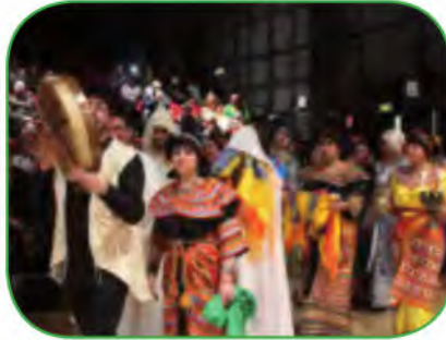
من أعراس منطقت القبائل