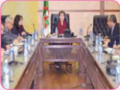
حِوَارٌ حَوْلَ قَضَايَا تَرْبِوِيَّةِ

3 - أَلَا حِظُّ الصُّورِ وَ أَكْتُبُ نَصَّ الحِوَارِ الَّذِي دَارَ فِي كُلِّ مِنْهَا بِإِختِصارِ بِناءِ عَلَى عَنائِينِها :