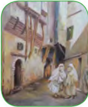
أَحَدُ شُوارِعِ القَصْبَةِ