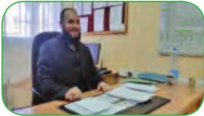
3 مُسْتَشَارٌ رَئِيسِيٌّ لِلتَّوْجِيهِ

أَقْرَأِ الْوَثِيقَةَ ثُمَّ عَدِّدِ الشُّعَبَ التَّعْلِيمِيَّةَ الَّتِي تُدْرَسُ فِي الثَّانَوِيَّةِ . أَيَّةُ شُعْبَةٍ تَفْضَلُ مُوَاصَلَةَ تَعْلِيمِكَ فِيهَا ؟ وَلِمَاذَا ؟ لَا حِظَّ الصُّورِ 1 ، 2 ، 3 وَ أَكْمِلْ : يُسِيرُ الثَّانَوِيَّةَ كُلُّ مَنْ : . . . وَ . . . وَ . . .