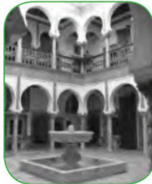
وَسَطُ بِنِيتِ بالقَصْبَةِ