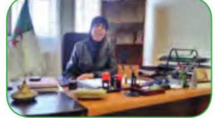
1 مَدِيرَةُ الثَّانَوِيَّةِ