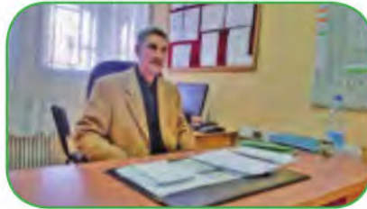
2 مُسْتَشَارٌ رَئِيسِيٌّ لِلتَّرْبِيَةِ